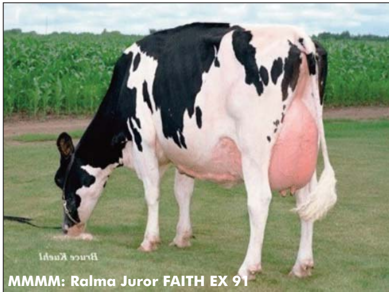
MMMM: Ralma Juror FAITH EX 91