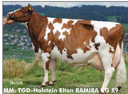
MM: TGD-Holstein Elton RAMIRA VG 89

Mit einer Rossmutter führt Rainbow völlig neues Blut für die Redholsteinzucht. Die Mutter ist in der 1. Lat. VG85 mit einem VG86 Euter eingestuft. Die G-Mutter ist VG98 mit einem EX Euter. Dazu hat sie 5 Laktationen 61'972 kg Milch gegeben und ist immer noch munter am produzieren. Die Leistung pro Lebenstag beträgt bis jetzt 23.2 kg Milch. Die Familie hat