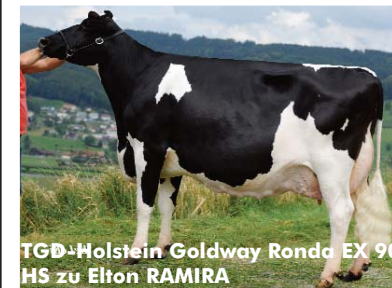
TGD-Holstein Goldway Ronda EX 90 HS zu Elton RAMIRA

Mit einer Rossmutter führt Rainbow völlig neues Blut für die Redholsteinzucht. Die Mutter ist in der 1. Lat. VG85 mit einem VG86 Euter eingestuft. Die G-Mutter ist VG98 mit einem EX Euter. Dazu hat sie 5 Laktationen 61'972 kg Milch gegeben und ist immer noch munter am produzieren. Die Leistung pro Lebenstag beträgt bis jetzt 23.2 kg Milch. Die Familie hat