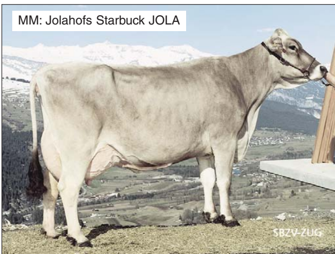
MM: Jolahofs Starbuck JOLA