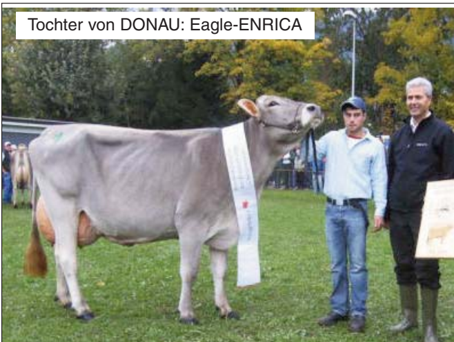
Tochter von DONAU: Eagle-ENRICA