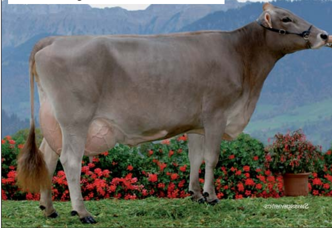
HS des Angebots: Starbuck-DONAU

Das Verkaufsangebot DOLLY ist eine Tau Tochter aus Eusebio-DROSSEL. Es hat eine ganz prominente Schwester, nämlich Starbuck DONAU EX98 (Euter EX99). DONAU, ebenfalls eine DROSSEL Tochter ist in der Szene bestens bekannt. Für einen ersten Höhenflug sorgte DONAU an der Nationalen Bruna 2006 mit dem Champion Titel, dann 2007 wurde sie Grand Champion an der LUBRA. Miss Amt Entlebuch wurde DONAU 5mal hintereinander und die aktuelle Miss Amt Entlebuch heisst Eagle-ENRICA, eine Tochter von DONAU. DONAU hat aber auch gute Leistungen gebracht. Die HL liegt bei 11'023kg Milch mit 4.3% Fett und 3.7% Eiweiss.